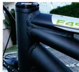
Massive 3 Rohre-Verbindung am Steuerrohr sorgt für maximale Verwindungssteifigkeit = hohe Fahrstabilität