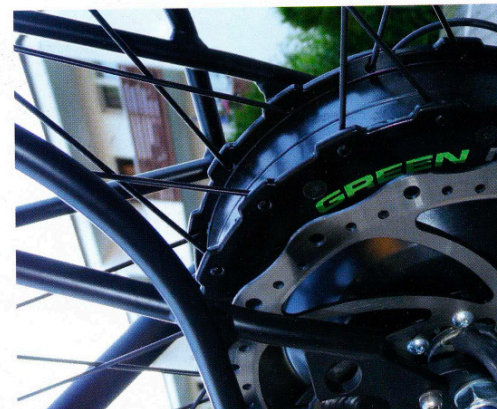
Großdimensionierte 208 mm-Scheibenbremsen am Bulls Green Mover-Motor. Der Ständer klappt automatisch an, wenn man das Rad aufstellt. Am Rad ungewohnt, aber so will es der Gesetzgeber.

Einstell- und blockierbare Federgabel mit extrastarken 32 mm Tauchrohren für optimierte Stabilität. Helles 60 Lux LED-Licht mit Tageslichtdioden – perfekt für Pendler