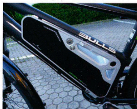
670 Wh-Akku, leicht ausbaubar, 4,5 kg, in 4 Std. voll, Schutzkappe, Netzanschluss schwer herausnehmbar

... leistung des Fahrers um 500 Prozent steigert! Ein E-Bike mit rasanten Fahrleistungen, das jeden Pendler zum Superman macht. Mit 29,9 Kilo erscheint es zunächst schwer, was sich aber angesichts der stabilen Rahmenkonstruktion, dem 4,5 Kilogramm schweren aber kapazitätstarken 670 Wh-Akku und der Kleinkraftrad-Ausstattung