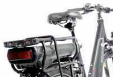
Auffällig: Die im Gepäckträger-Ende integrierte Rückleuchte bildet ein Lichtband