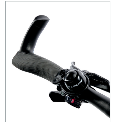
Ergonomische Griffe, ergänzt um Lenkerhörnchen für variable Griffpositionen.