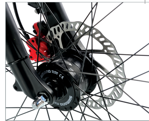
Zuverlässigkeit, Sicherheit und tolle Optik vereint: Nabendynamo und Scheibenbremse

Mit dem sportlichen Solero Disc bringt Pegasus ein stabiles, verlässliches und sportives Rad, das mit Optik und Fahrfreude begeistert – und das zu einem attraktiven Preis.