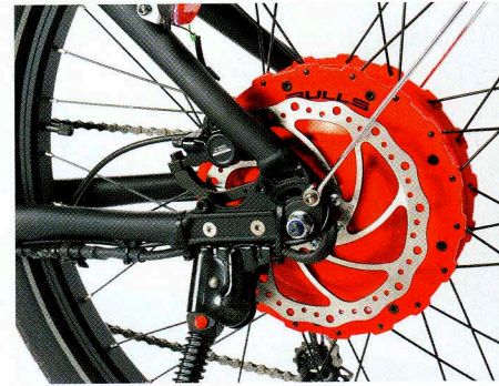
Signalfarbe Rot: Hier wird deutlich, dass der Heckmotor das Herzstück ist.