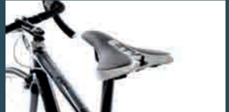
Der Sattel von STYX passt gut zum Rad, ist schmal geschnitten und bequem.