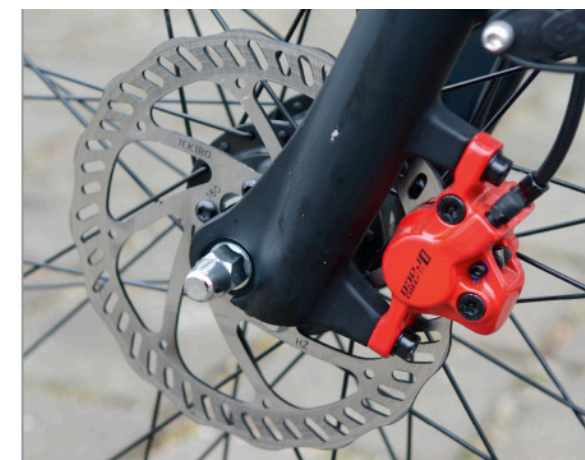
Zuverlässigkeit, Sicherheit, Optik: Scheibenbremse und dahinter der Nabendynamo

Mit dem Solero SL Disc bringt Pegasus ein schickes Alltagsrad, das auch sportiven Ansprüchen mehr als gerecht wird. Klare Sache: Optik und Fahrfreude zum top Preis-Leistungs-Verhältnis.