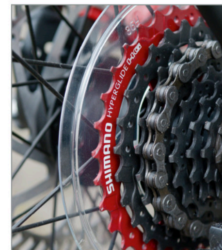
Auffallend im Hinterrad: das große, rot eloxierte Ritzel. Es ist am Berg Gold wert.